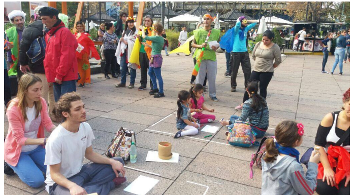
Foto: Plaza Fabini, Fanfarria Invernal Centro Cultural URBANO