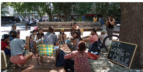
Foto: Plaza de los 33 orientales

El "Living" propone un marco para conversar, para intercambiar pensares y sentires sobre alguna temática en particular. Sucede en la calle, en el espacio público, allí donde todas y todos tenemos el mismo derecho a expresar, o así debería ser. El dispositivo propone que las personas estén sentadas, compartiendo algo para tomar y comer. Esto habilita un cuerpo a destiempo con el entorno, personas en ronda sentadas, compartiendo, conversando y disfrutando de ese presente en calma en medio de la ebullición citadina, creando posibles soluciones y ensayando in-situ modos de estar juntas.