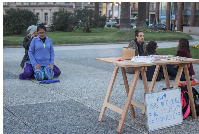
Foto: Plaza Independencia