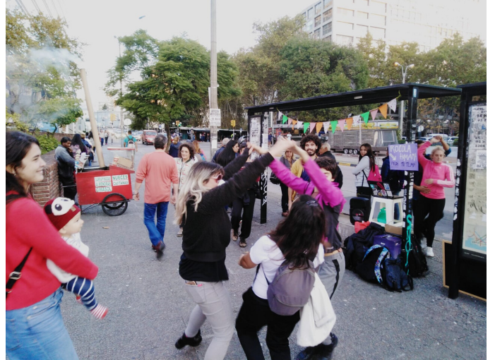
Foto: Parada de bus Fernández Crespo y Colonia

¡Bailate unas! Elegimos una parada de bondi y te armamos la fiesta. Montamos parlante, sacamos cotillón, armamos trencito y así se van encadenando acontecimientos bailables populares que nos remiten a una fiesta típica de por acá. Durante 1 hora se suceden canciones de todos los tiempos que te invitan a bailar, tararear tímidamente, o al menos sonreír. Nos bailamos a las 16hs en alguna parte de la ciudad.