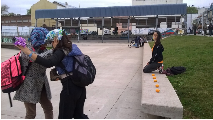
Foto: Plaza Pepe D' Elía