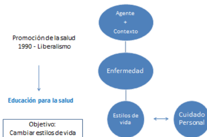
Figura 2: Modelo de educación para la Salud bajo políticas de corte neoliberal.

Este modelo, acusado en muchos casos de conductual, utópico, autoritario (ya que no reconoce otros saberes que no sean los "expertos"; saberes docentes-saberes médicos), descontextualizado (a-histórico) y mercantilista (desaparece la responsabilidad del estado y traslada el gasto a las personas), se centra cada vez más en la responsabilidad individual (culpógeno y meritocrático), llegando a desaparecer en muchos casos la importancia de las obligaciones del Estado en las acciones relacionadas con la consideración de la Salud como un derecho. Este énfasis en el cuidado personal con ausencia del Estado comenzó a cobrar mayor vigencia en muchos países en los últimos 30 años, bajo políticas de corte neoliberal (Figura 2). Baste mirar la problemática de la pandemia que atravesamos y preguntarnos de quién es el gasto principal en los diferentes países (dejaremos este análisis para un próximo artículo).